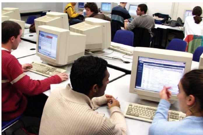
Hommes, femmes, même cerveau ?

« Quelle est la différence entre le cerveau des hommes et celui des femmes ? La réponse n'est pas simple parce que le cerveau n'est pas un organe comme les autres : il est le siège de la pensée », explique Catherine Vidal en introduction de son ouvrage Hommes, femmes, avons-nous le même cerveau ? Ces questions ne sont pas anodines car, au-delà, se profile un débat idéologique sur la part de l'inné et de l'acquis dans les comportements de chacun. « Idées reçues et fausses évidences