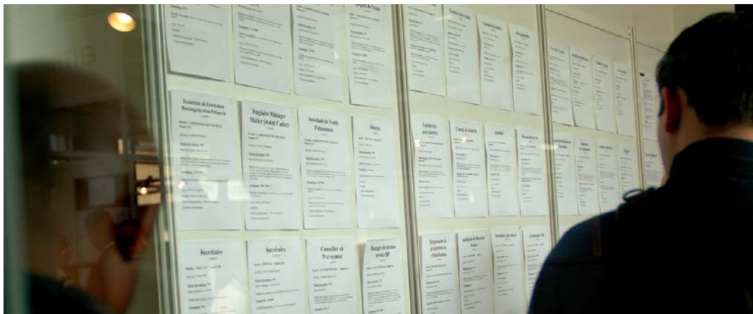
Grâce au Plie, 26 parrainés sur 36 ont trouvé un emploi ; 3 une formation qualifiante.